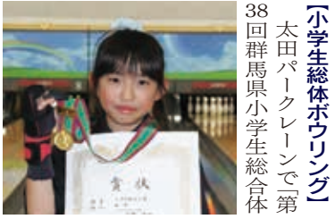
「小学生総体ボウリング」太田パークレーンで「第38回群馬県小学生総合体