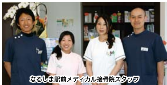
なるしま駅前メディカル接骨院スタッフ