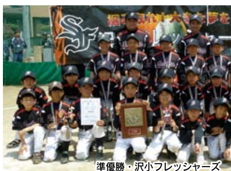
準優勝・沢小フレッシューズ

「天田市スポ少軟式野球」第34回天田市スポ少ソフトボール大会(主催 天田市・天田市スポ少少年団)▽主審 天田市野球連盟▽後援 天田ライオンズクラブ)の決勝戦が、4月29日天田市由良町の八千代球場で行われ、決勝に進出したのは、