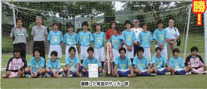
優勝した尾島中サッカー部