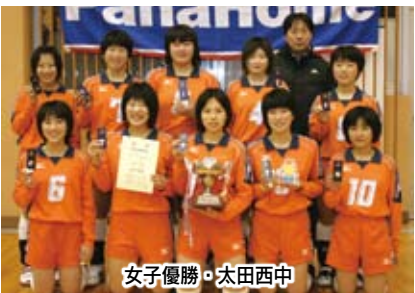
女子優勝・太田西中