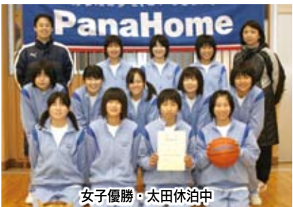
女子優勝・太田休泊中

【男子】①館林二②太田南③太田西、大泉北 【女子】①太田休泊②板倉③太田城西、大泉南