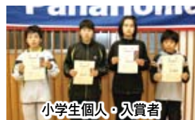
小学生個人・入賞者