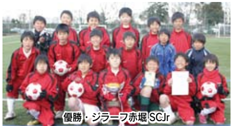
優勝・ジラーフ赤堀SC Jr

【1位ブロック】①ジラーフ赤堀SC Jr ②宝泉東小SSS③桐生境野FC④GKF 【2位ブロック】①高崎KII②FC碓東③ FC新田88④行田サウスフェニックス