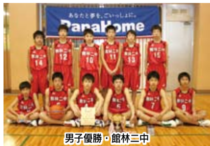
男子優勝・館林三中