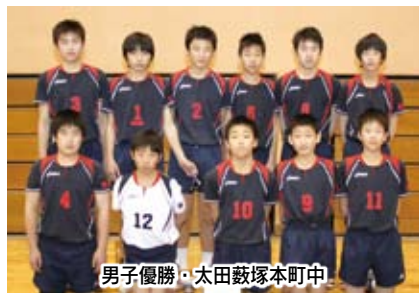
男子優勝・太田飯塚本町中