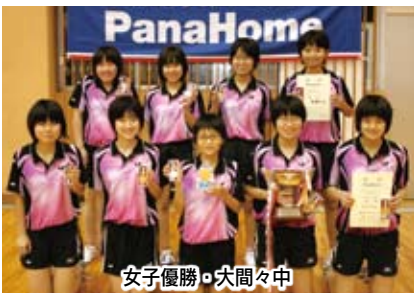
女子優勝・大間々中

*各大会の試合結果はホームページhttp://www.ota-sports-academy.comをご覧ください。