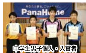
中学生男子個人・入賞者